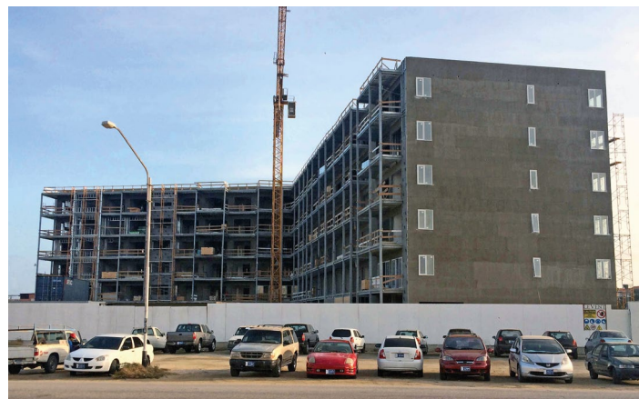
Aruba - Caribe