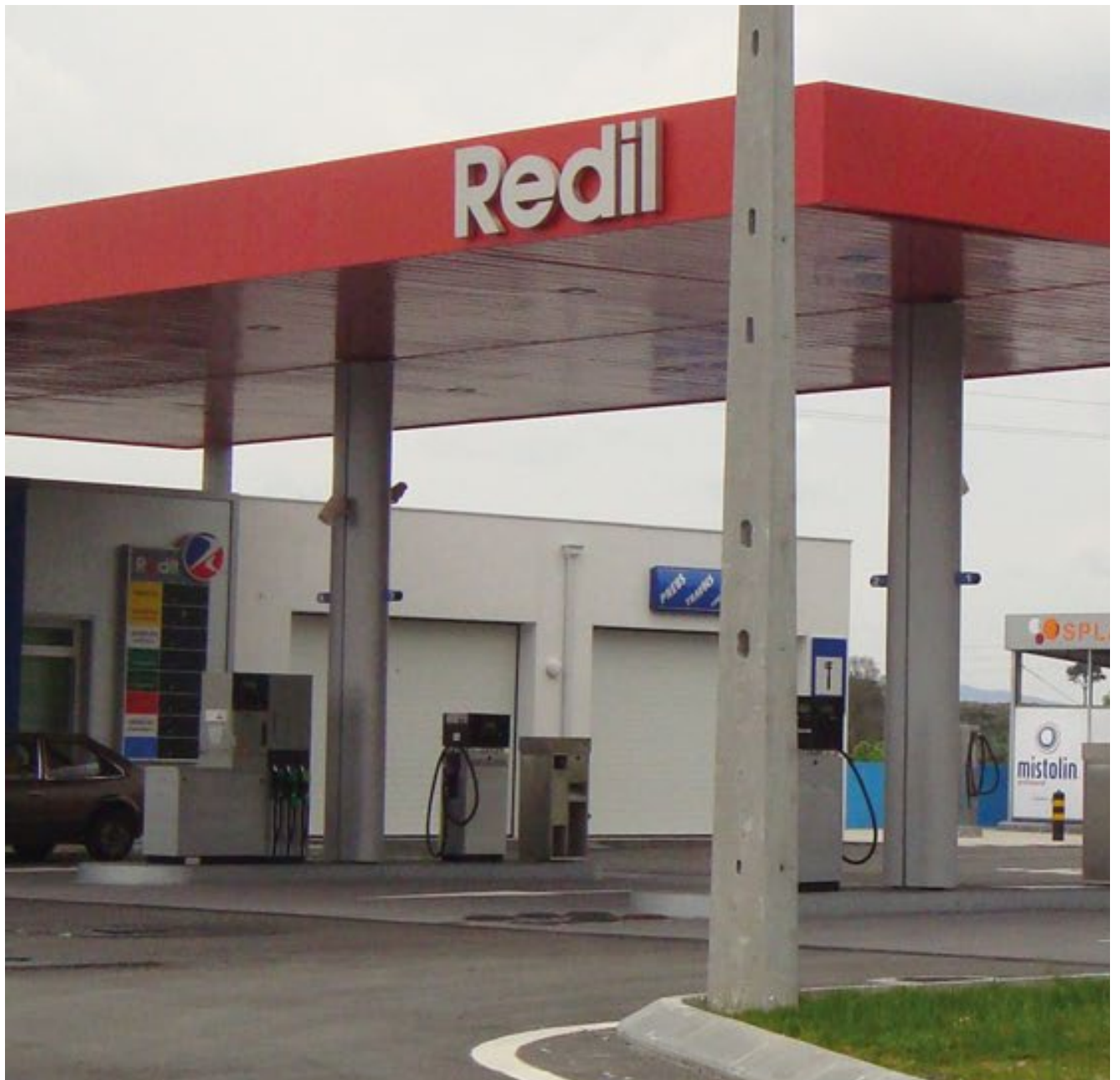
Celorico da Beira. Portugal