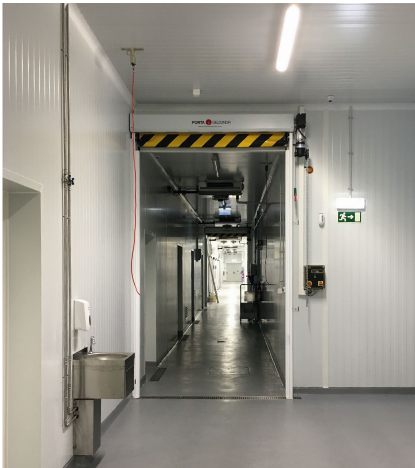
Vila do Conde. Portugal