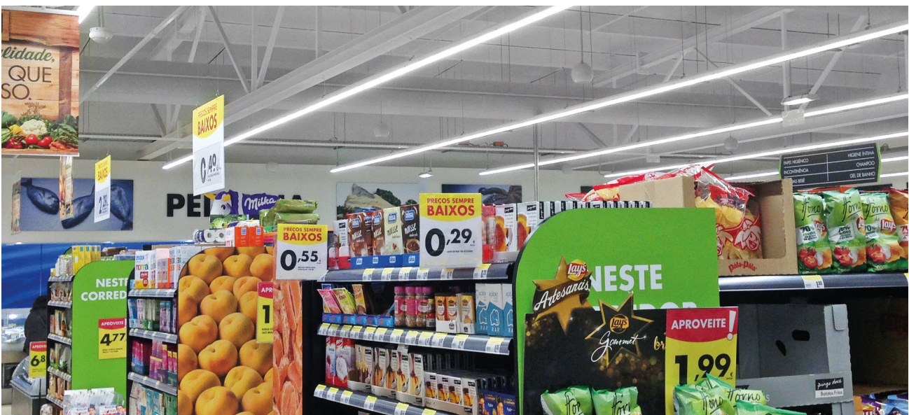
São Romão do Coronado. Portugal