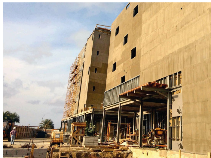
Vila Nova de Gaia. Portugal