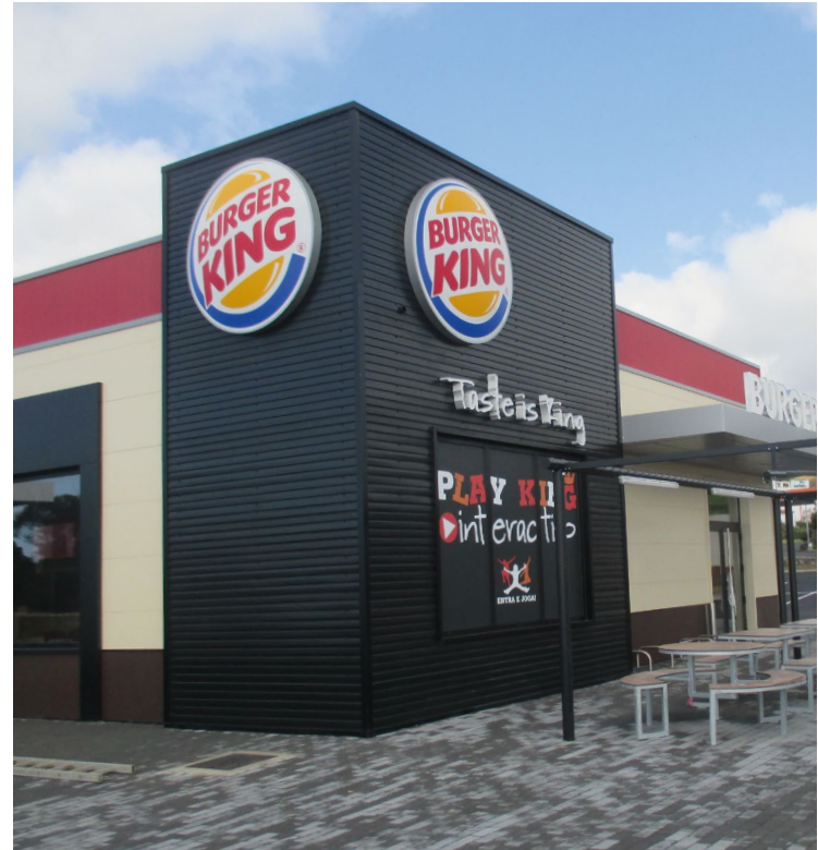
Ilha Terceira - Açores. Portugal